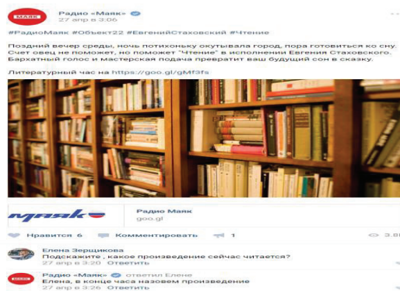
Рис. 2.

ВЫВОДЫ. Проведённый анализ показал, что информационно-коммуникационные изменения привели к тому, что современный радиотекст воспринимается как гипертекст, который репрезентируется средствами разных семиотических систем, то есть является поликодовым. Организационно-коммуникативным центром гиперрадиотекста становится сайт радиостанции. В качестве гиперссылок выступают метатекстовые вербальные и невербальные единицы. Сайт радиостанции и выход радио в социальные сети отражают не только процессы конвергенции СМИ, но и связь радио с новыми медиакommunikациями, что кардинальным образом расширяет представление о поликодовости радиодискурса. Изучение функционирования радиотекста в аспекте его поликодовости подтверждает гипотезу о том, что, будучи нелинейным, многоуровневым, полижанровым образованием, радиотекст может быть квалифицирован как гипертекст и что одной из ключевых характеристик традиционно устной формы медиатекста является поликодовость. Рамки публикации позволили рассмотреть два уровня поликодовости, в основу выделения которых положен способ представления радиотекста и способ его восприятия адресатом. При этом проведённый анализ свидетельствует о наличии оснований для дальнейшего углубления анализа, направленного на более детализированное изучение специфики поликодовости гиперрадиотекста внутри как первого уровня поликодовости, так и второго, то есть у заявленной темы есть научные перспективы.