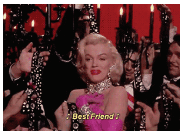
рис.3 Gentlemen Prefer Blondes / 20th Century Fox, 1953 (новость «Алмазы сформировались из океанского дна», nplus1.ru )

Таким образом, можно отметить, что принципиальным отличием sciencenews в научно-популярных медиа является их независимость от федеральной новостной повестки и ориентация на более подготовленную аудиторию. Как следствие, при организации многоуровневого текста адресанты обладают большей свободой в подаче информации, могут изменить привычное расположение структурных частей (например, бэкграунда) или подобрать иллюстрацию в виде мема. При этом сам текст новости отличается большей терминологической наполненностью, а обязательным условием является прямая ссылка на оригинальное исследование, по которому и была написана новость.