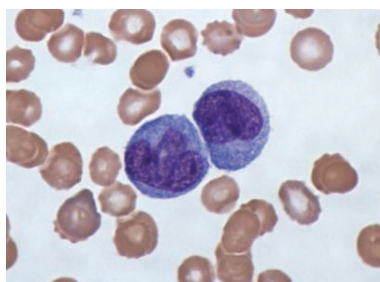
рис. 2 Моноциты в цифровом микроскопе. Фото. Dr. Graham Beards / Wikipedia (новость «Как иммунитет помогает метастазам», www.nkj.ru)